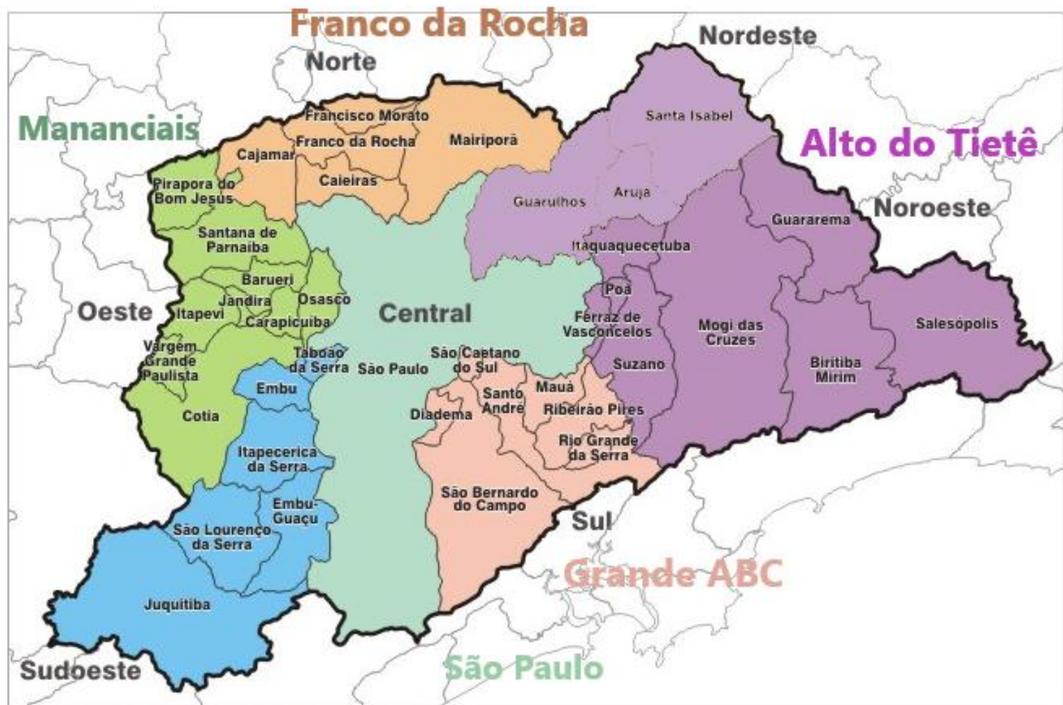
Rota dos Bandeirantes